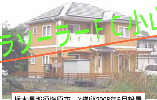
栃木県那須塩原市 Y様邸2008年6月設置