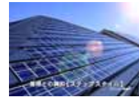
ソーラー発電システム